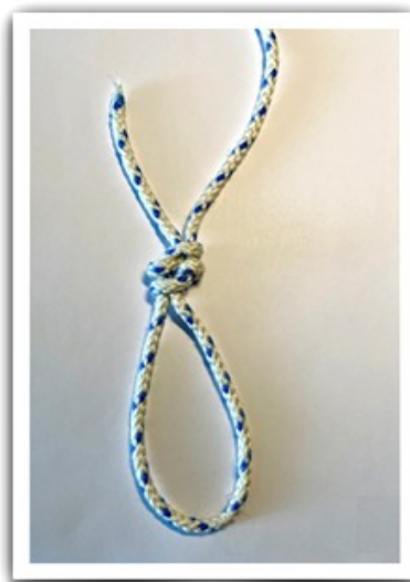
Les deux faces du nœud terminé

Ce tutoriel permet de créer un nœud de guide au milieu d'un cordage sans l'utilisation des extrémités, cette méthode de nouage est dite « dans la ganse ».